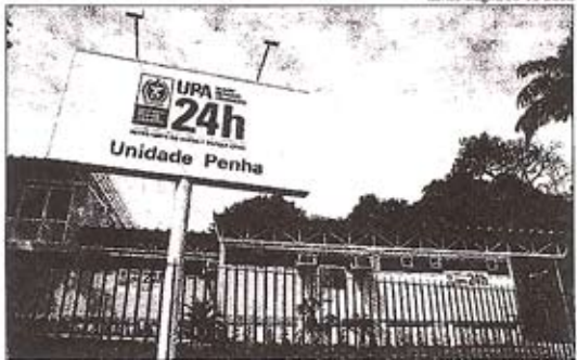
A UPA 24 horas inaugurada na Penha: 40 unidades custariam R$ 65 milhões

promessa do prefeito eleito é triplicar número de vagas, chegando a 160 mil. Custo só com construção é de R$ 702 milhões, sem contar custeio e manutenção